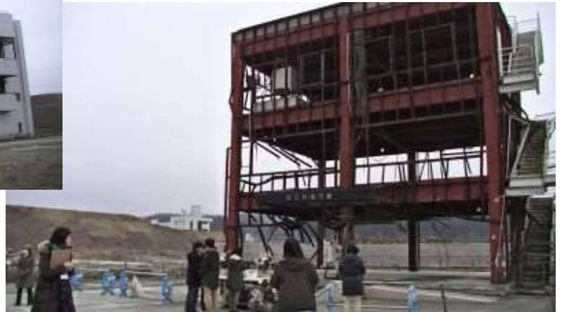
最後まで留まって放送を続けた防災対策庁舎は全壊した