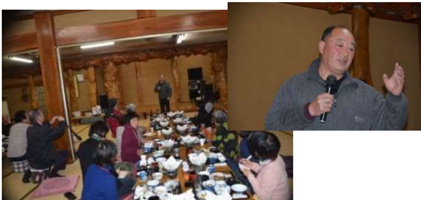
高倉荘主人の体験談に聞き入る