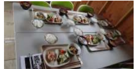
長洞元気村のお母さんとお昼作り ワカメしゃぶしゃぶ と 新鮮な牡蠣しゃぶ お代わり自由