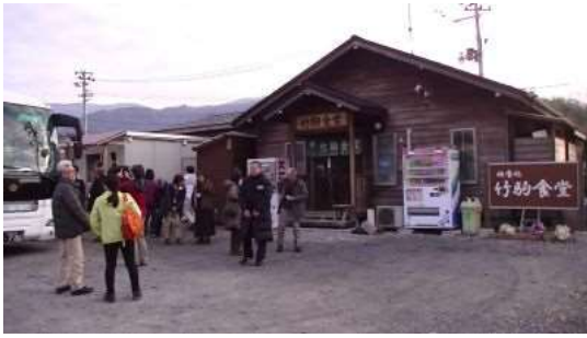
逗子市が支援している竹駒食堂