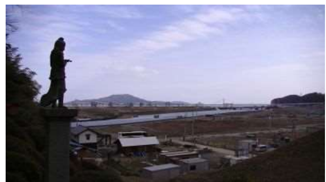
橋は流され橋脚のみが残った (遠景)