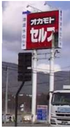
G Sの看板にここまで津波がの表示