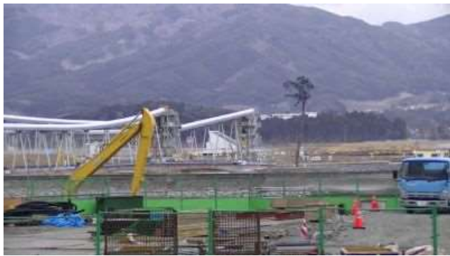
巨大ベルトコンベヤーで奇跡の一本松が・・・