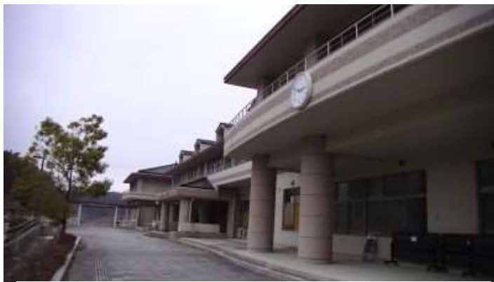
戸倉中学の時計は311の2時48分を指していた