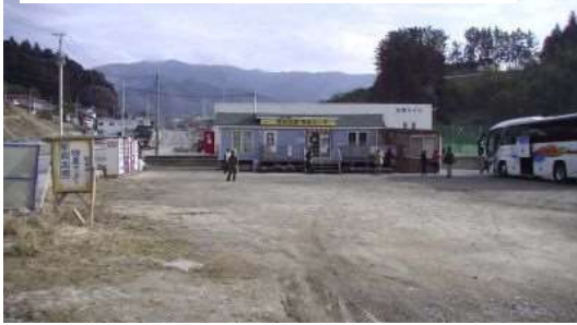
陸前高田物産センター・公衆トイレ