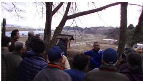
ここから襲い来る津波をただ眺めるだけでした