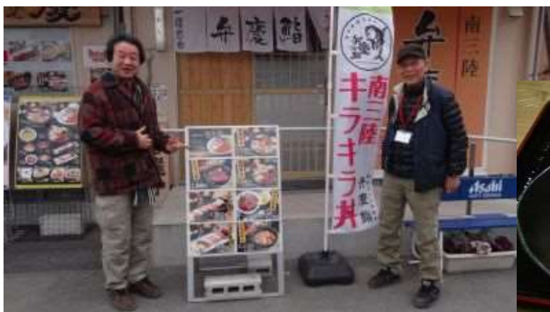
キラキラ丼で賑わう海鮮食堂