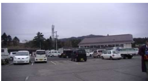
校内には今も仮設住宅が