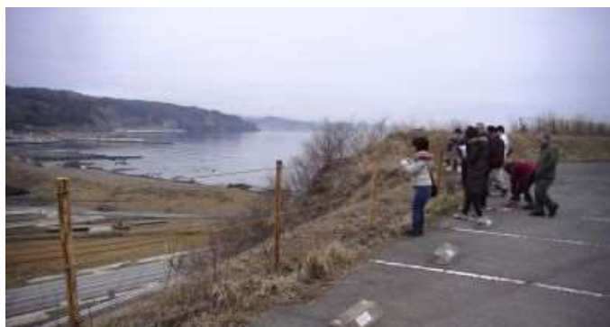
高台にあるここまで津波は来た、眼下の戸倉小は跡形もない