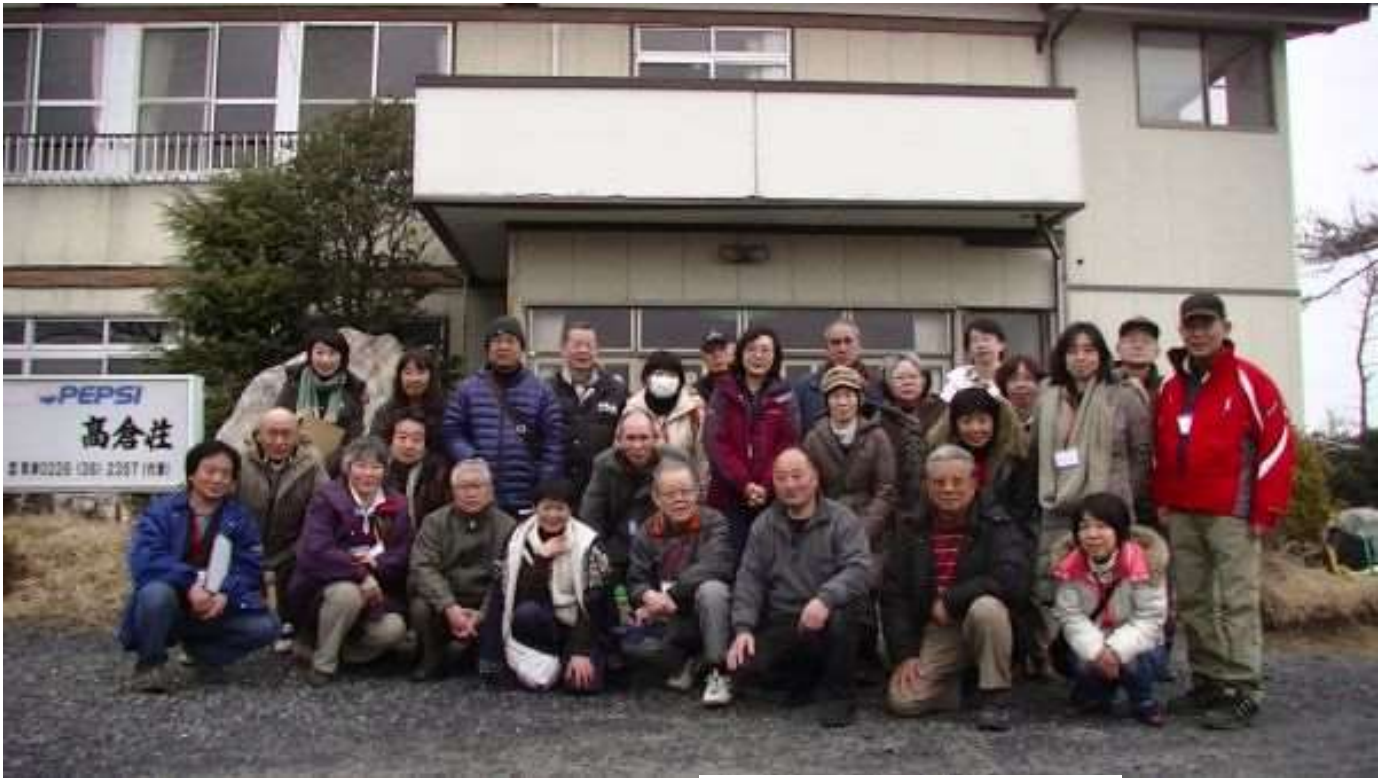
高倉荘の前で記念の一枚