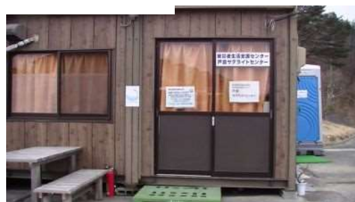
傍らには被災者生活支援センター 戸倉サライトが今も被災者を支えている