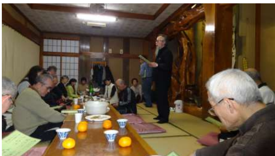
歌津中学元校長の判断が生徒の命を救った、貴重な体験談を伺うことが出来ました