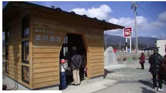
河野氏によるが 追悼施設、道の駅跡など