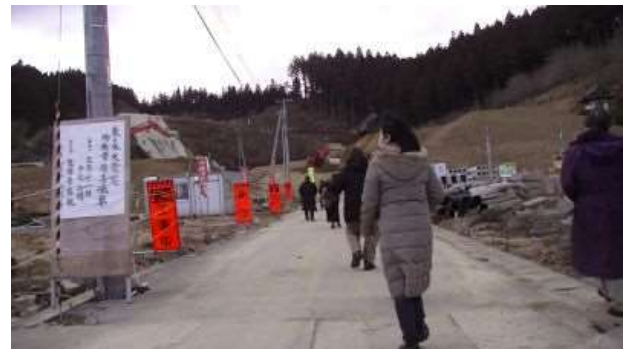
気仙成田山へ避難した人の足跡を体験