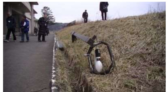
津波で折れ曲がった外灯は今もそのまま