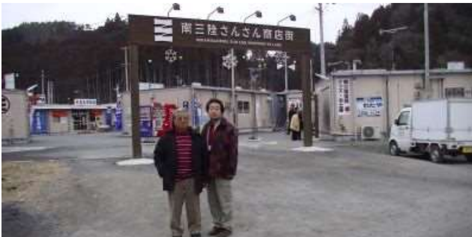
観光客で賑わう 南三陸さんさん商店街 来年には高台に移転する