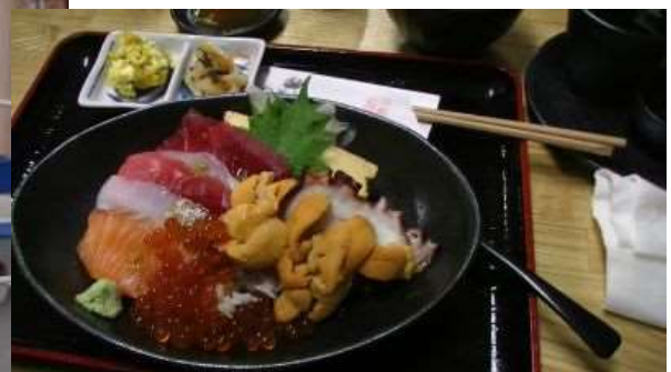
これは、贅沢丼です 最高！