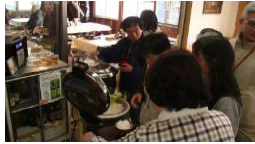
朝食はセルフ ¥500 でコヒ付