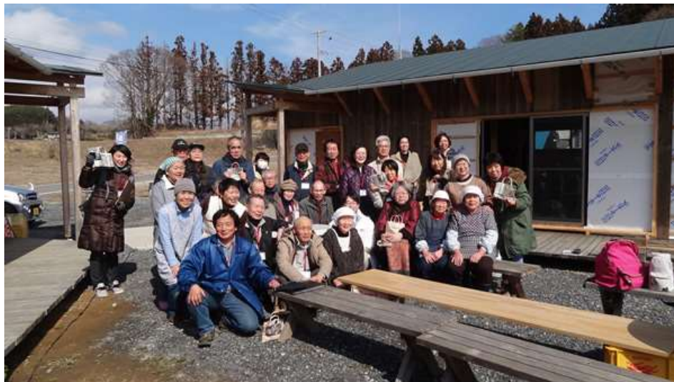
交流のあと記念写真を撮りました。元気村の皆さんの笑顔が素敵でした。