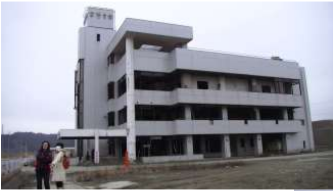
屋上に避難して生き延びた高野会館